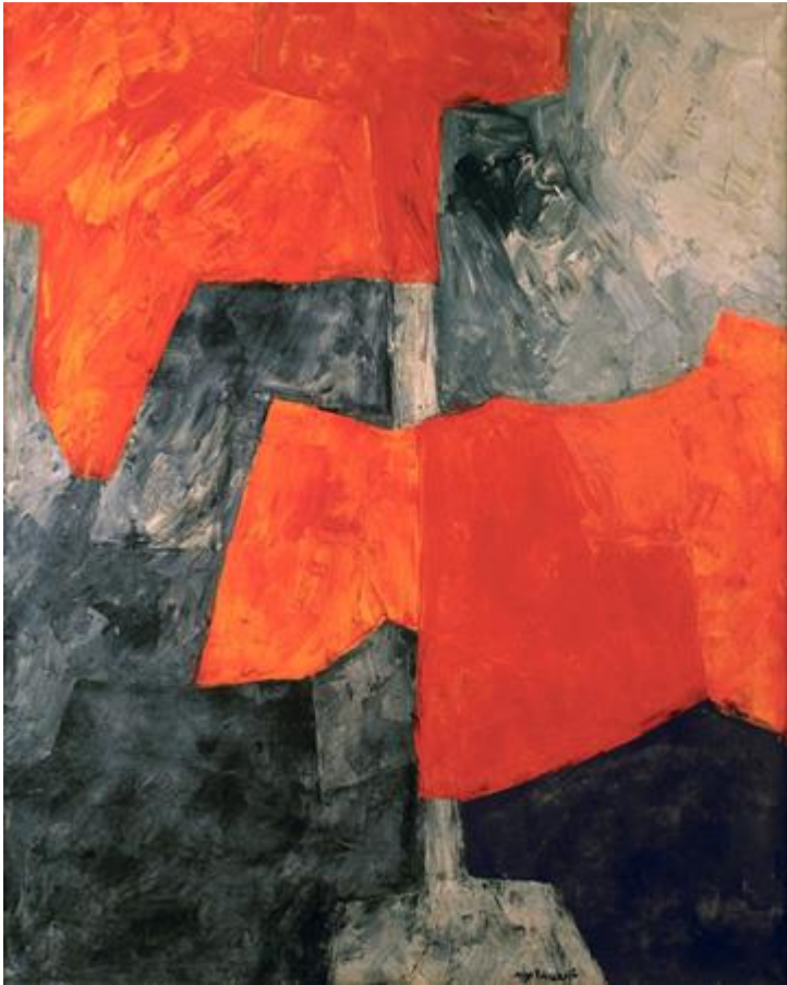
"Composition grise et rouge" Óleo sobre lienzo pintado en 1964 Serge Poliakoff pintor francés.