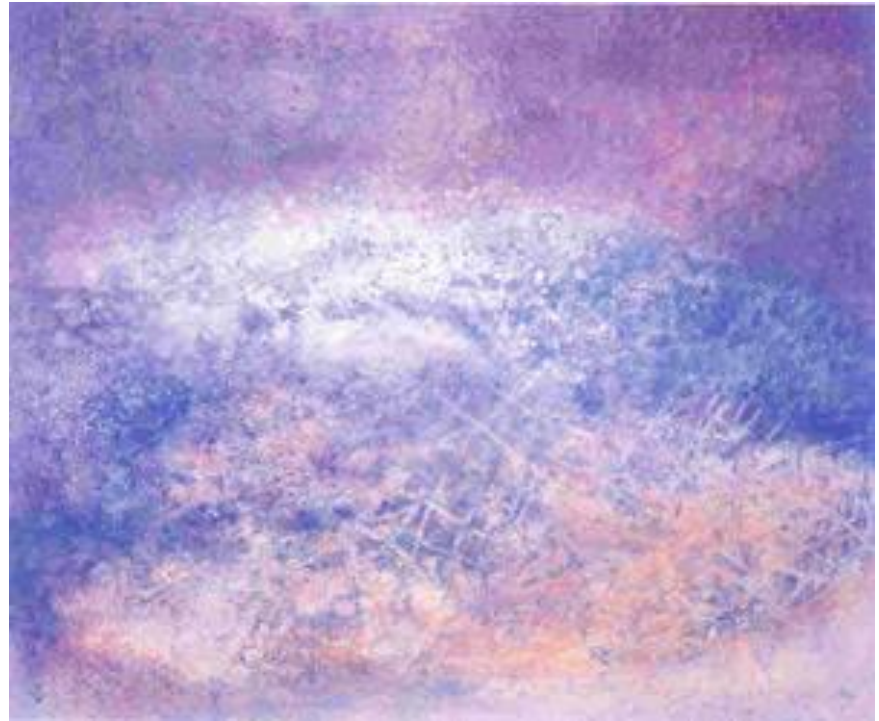
"Sincronía" (1998). Mixta sobre tela 100 x 120 cm