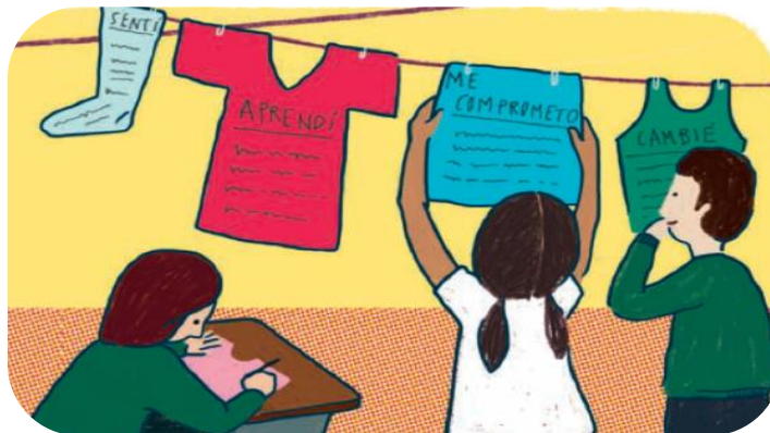
Dirección General de Materiales Educativos. (2019). Formación Cívica y Ética. Sexto Grado. Primaria. (P.41) Dirección General de Materiales Educativos de la Secretaría de Educación Pública.

Revisa lo que escribiste y comparte el tendedero con tu familia.