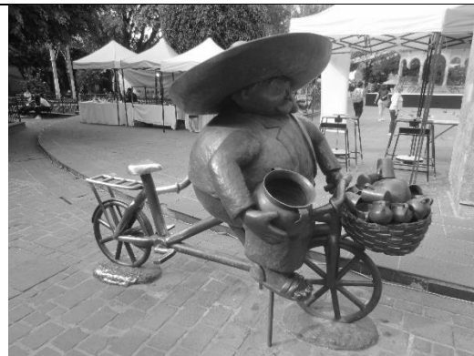
"Vendedor de cohetes gordos en una bicicleta", elaborado por Rodo Padilla. Ubicación: Centro de Tlaquepaque, Jalisco.

https://zonaguadalajara.com/wp-content/uploads/2013/10/La-Estampida.jpg https://www.google.com/url?sa=i&url=https%3A%2F%2Fcommons.wikimedia.org%2Fwiki%2FFile%3AGuadalajara%2C%20Jalisco%2C%20M%25C3%25A9xico%2032.0.jpg&psig=AovVawlyEo23zCqWocqE2cycMSn4&ust=1653061212284000&source=images&cd=vfe&ved=0CAKQJRxgFwoTCIDiQy706_cCFQAAAAAAdAAAAABAD https://upload.wikimedia.org/wikipedia/commons/thumb/c/c2/El_p%C3%A1jaro_de_fuego_3.JPG/800px-El_p%C3%A1jaro_de_fuego_3.JPG?20150125231555 https://live.staticflickr.com/5561/31589448132_5461cf6d2f_b.jpg https://upload.wikimedia.org/wikipedia/commons/3/30/Tlaquepaque%2C%20Jalisco%2C%20Mexico%202021_-_031.jpg