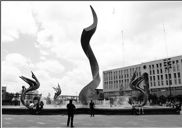
"La inmolación de Quetzalcóatl" escultura de Víctor Manuel Contreras, ubicada en Plaza Tapatia.