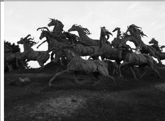
"La Estampida", elaborada y diseñada por Jorge de la Peña. Ubicación: Glorieta de las jicamas, en el cruce de la avenida López Mateos y avenida Niños Héroes.