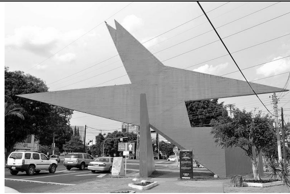
"Pájaro de fuego" de Mathias Goeritz, conocido como "El pájaro amarillo". Ubicación: Cruces de avenida Inglaterra y avenida De Los Arcos en Guadalajara, Jalisco. Vista desde el sur.